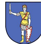
BSV Bad Bramstedt